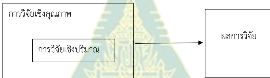
แผนภูมิ 2.2 ลักษณะการวิจัยผสมผสาน แบบรองรับภายใน (Creswell, J.W. 2006: 68)

การวิจัยแบบผสมผสานแบ่งออกเป็น 2 ลักษณะ (พวงผกา คงวัฒนานนท์ 2556, น. 650) คือ การวิจัยแบบผสมผสานชนิดต่อเนื่อง (sequential mixed qualitative and quantitative research) และการวิจัยแบบผสมผสานชนิดดำเนินการไปพร้อมกัน (simultaneous mixed qualitative and quantitative research) สำหรับการวิจัยครั้งนี้เป็นการวิจัยแบบผสมผสานชนิดต่อเนื่อง แบบรองรับภายใน (Embedded design) (Creswell, J.W. 2006: 68) ซึ่งเป็นแบบแผนการวิจัยแบบผสมผสานรูปแบบหนึ่งที่มีการจัดให้วิธีการวิจัยแบบหนึ่งเป็นวิธีการหลัก และวิธีการอีกแบบหนึ่งเป็นวิธีการรอง เพื่อให้ได้ข้อมูลทั้งด้านปริมาณและคุณภาพสนับสนุนซึ่งกันและกัน (รัตนะ บัวสนธ์, 2554)